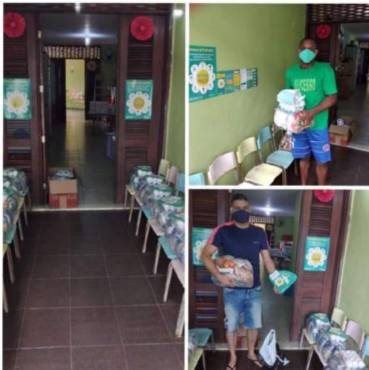
Creche Algodão Doce