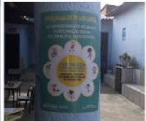
Creche Brincando e Aprendendo