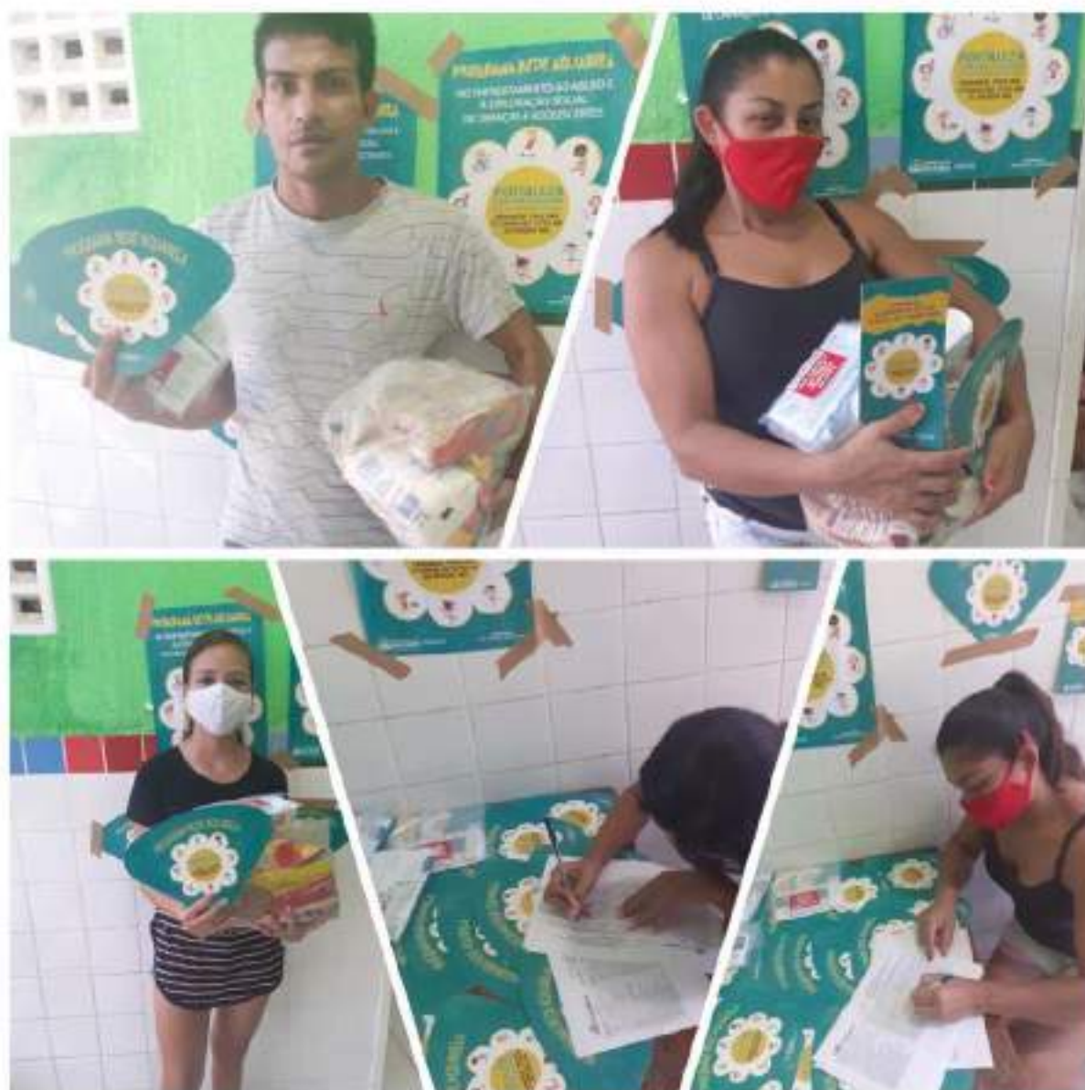
Creche São Judas Tadeu