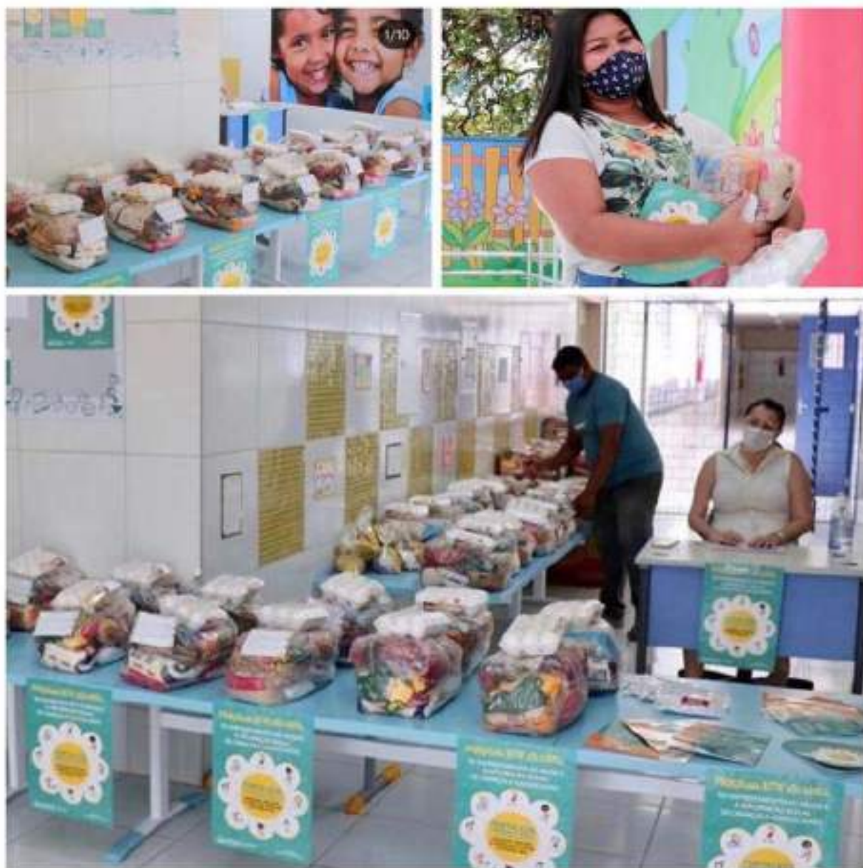
CEI Manoel Pinheiro dos Santos