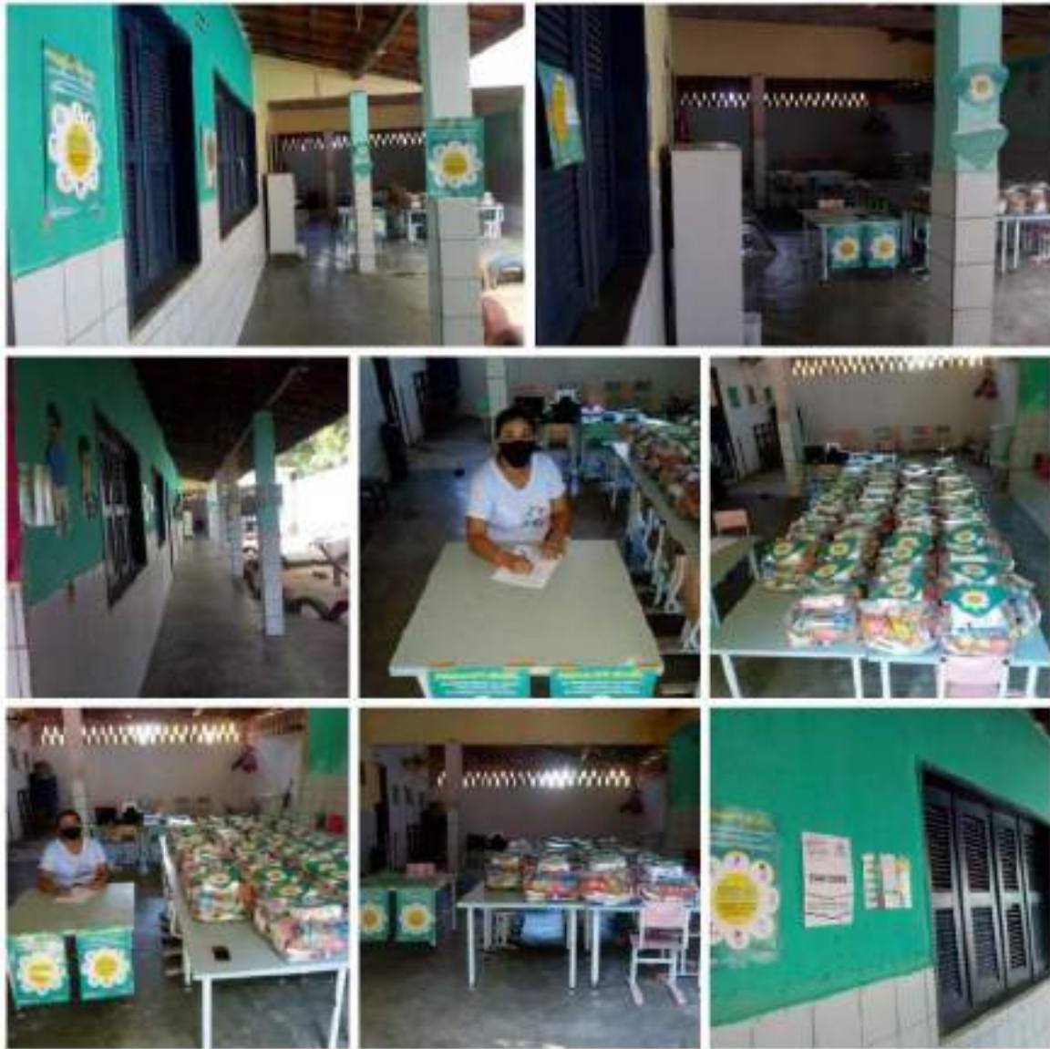
Creche Pôr do Sol