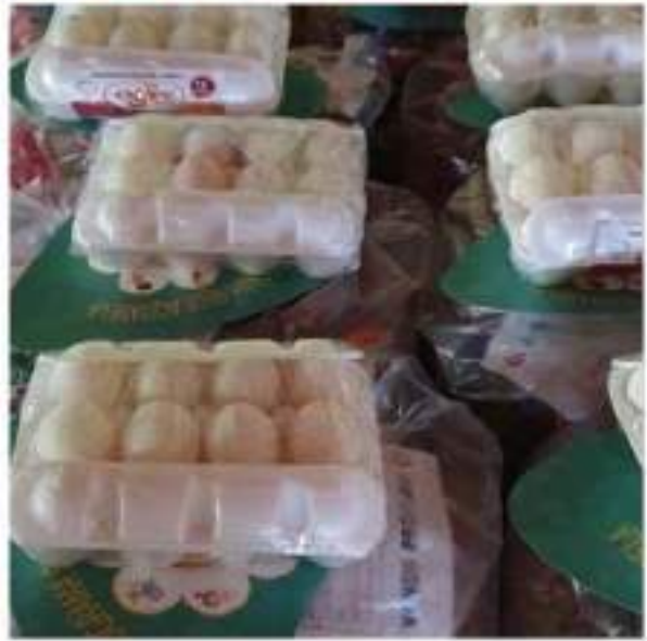
CEI Melo Jaborandi