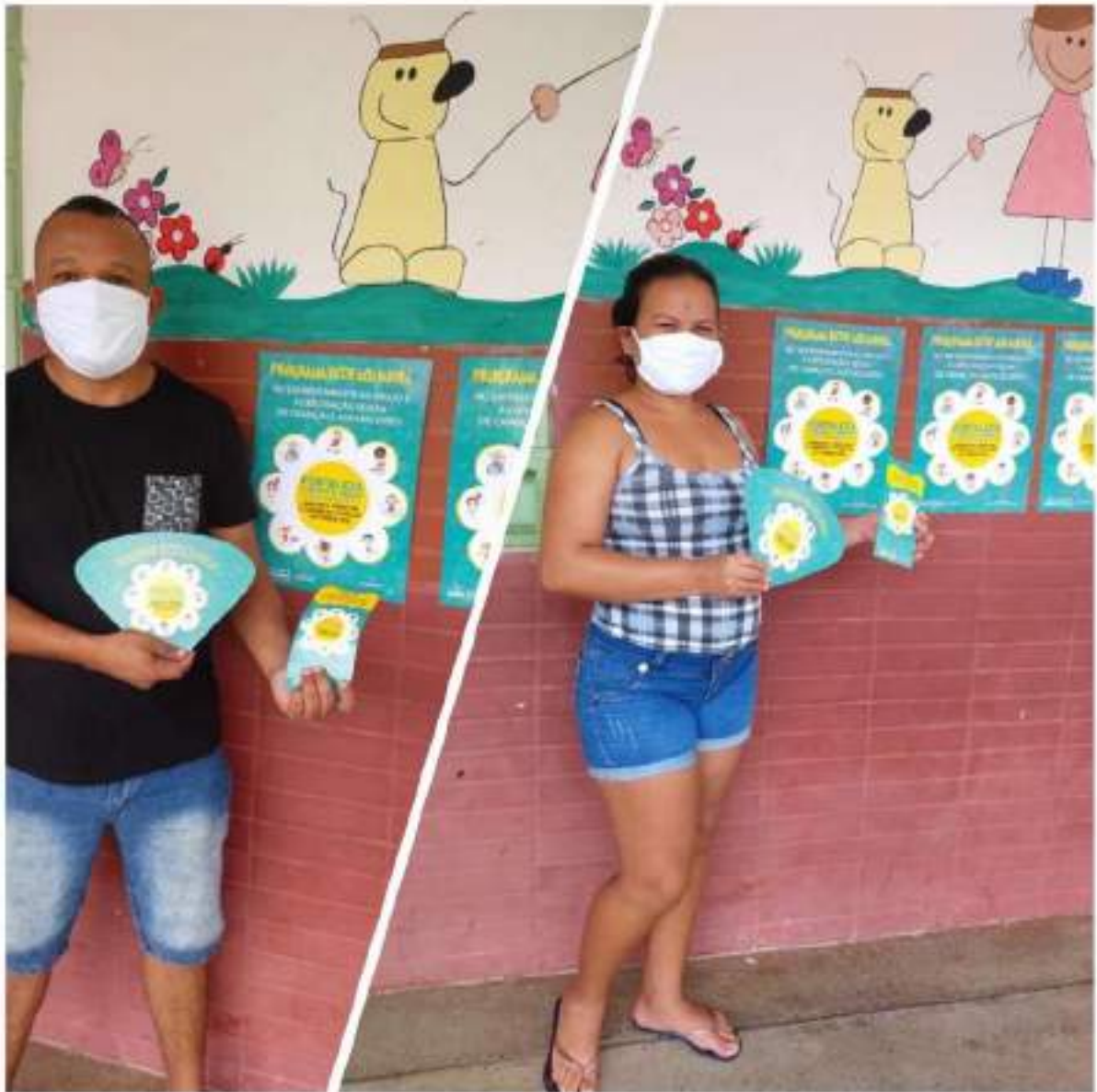
EMEIF Maria de Carvalho Martins