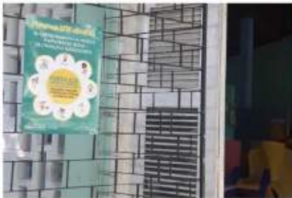
Creche Maria Zélia Correia